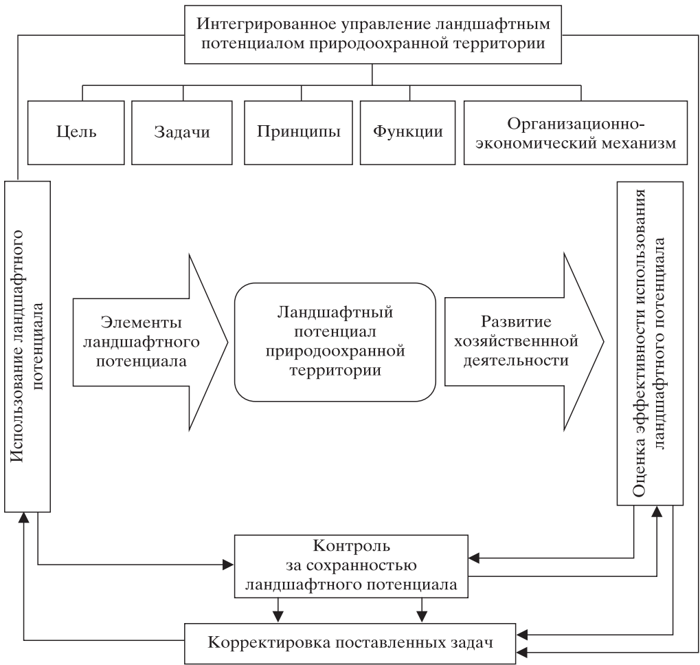
Рис. 2. Схема интегрированного управления ландшафтным потенциалом природоохранной территории

На сегодняшний день отсутствует единый методологический подход к определению и формированию организационно-экономического механизма управления ландшафтным потенциалом.