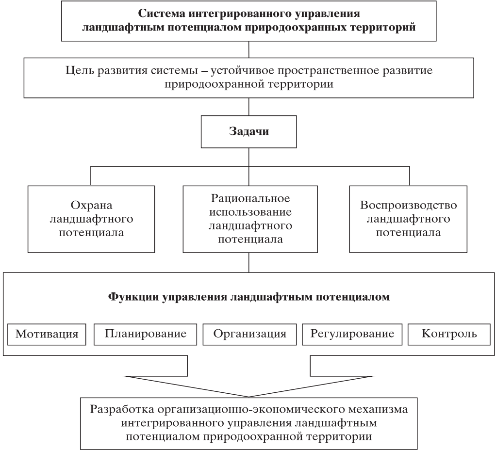
Рис. 1. Содержание интегрированного управления ландшафтным потенциалом природоохранной территории

Основными функциями интегрированного управления ландшафтным потенциалом природоохранной территории выступают мотивация, планирование, организация, регулирование и контроль.